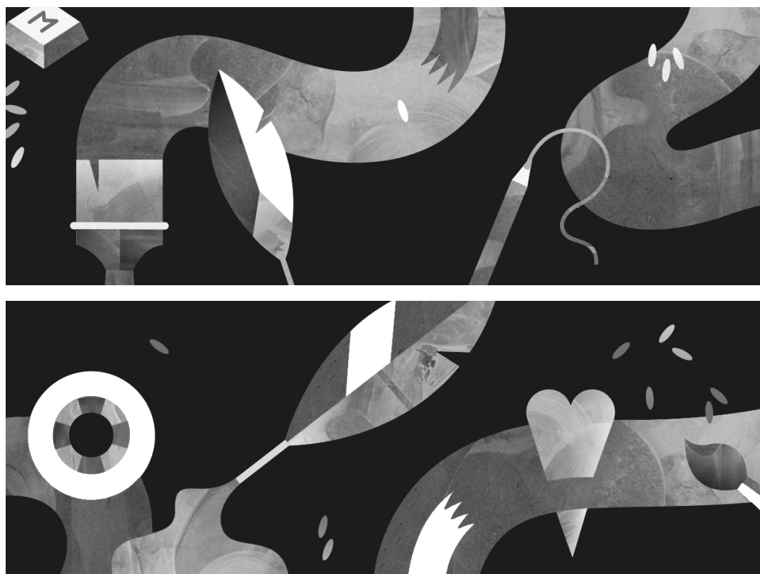
Kuva: Janine Rewell, instituutin tilaustyö vuoden 2013 visuaaliseksi ilmeksi

Open Knowledge Foundation / Blueprint Magazine / World Design Capital Helsinki 2012 / Helsinki Design Week / London Design Festival / Music Finland / The Architecture Foundation / The Finnish Museum of Architecture / London Wildlife Trust / Dublin Community TV / Liverpool Biennial / Studio EMMI / Janine Rewell / Aalto University Media Factory / Forum Virium / The Finnish Innovation Fund (Sitra)