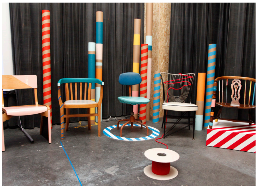
Kuva: Aleksi Niemelä, HEL/LO - Let’s Talk About Tomorrow, London