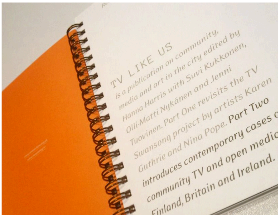
Kuva: Reaktio #2: TV Like Us

TV LIKE US toi yhteen yhteisötelevisiion kanssa työskenteleviä taiteilijoita, tutkijoita ja teknologiakehittäjiä. Kirjan artikkelit osoittavat, että televisiolla on edelleen tiukka ote kollektiivisesta mielikuvituksestamme. Yhteisötelevisiosta on tulossa tärkeä tekijä muuttuvalla mediakentällä. Samalla yhteisötelevisio vahvistaa kansalaisuutta, kertoo tarinoita ja auttaa yhteisöjä saamaan äänensä kuuluviin yhdessä tekemisen kautta. TV LIKE US kattaa aiheita taiteilijatelevisiosta avoimiin media-alustoihin. Kirjassa esitellään tapauksia, metodeja ja ideoita elävän paikallisen televisiokulttuurin takaa.